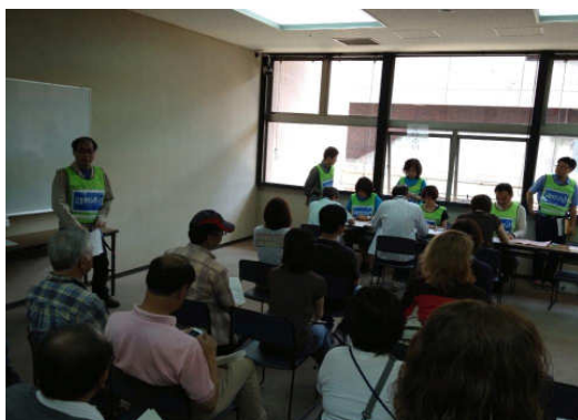
Team Aid for Japan ～ しょうなん茅ヶ崎災害ボランティア

今回の参加者は前回から減少して総勢 39 名、TAJ のメンバーの参加も 16 名でした。今後第三回目を考えるときに、「いかに参加率を上げるかという事」が課題として上げられました。